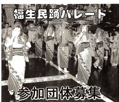
福生民踊パレード 参加団体募集

☆参加者多数の場合は、主催者側で選考します。 問合せ 福生青年会議所(☎5112927)へ。