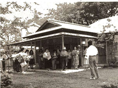
▲純和風建築の茶室「福庵」