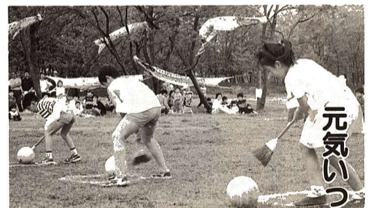
元気いっぱい子どもたち

5月5日多摩川中央公園で、田園会館主催による「子どもの日フェスティバル」が行われました。当日、集まった幼児、児童は約1500人。田園会館OBの中学生と職員で作成した7匹のこいのぼりの見守る中、「おそうじまかせ」など12種類の競技を思いっきり楽しんでいました。