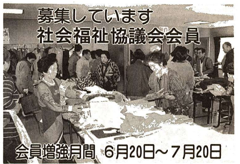
募集しています 社会福祉協議会会員