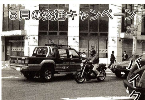
5月の交通キャンペーン