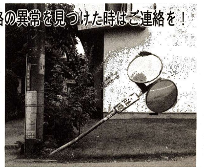
交通安全施設や道路の異常を見つけた時はご連絡を!

「照明灯が切れている」「カーブミラーが壊れている」「道路に穴があいている」など、日ごろ市民の皆さんからご連絡いただき、ありがとうございます。 市では、道路状況と交通安全施設の点検を行っています。これだけでは、道路と交通安全施設を良好な状態で維持していくことは困難です。