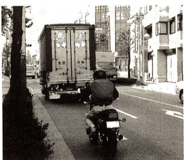
大型車の動きには特に注意を!

大型車は内輪差が大きいので、狭い道路へ左折するときは、いったん右側へふくらまないと曲がり切れないことがあります。そのため後続のバイクや車からは、まるで右折して行くかのように見えるし、実際