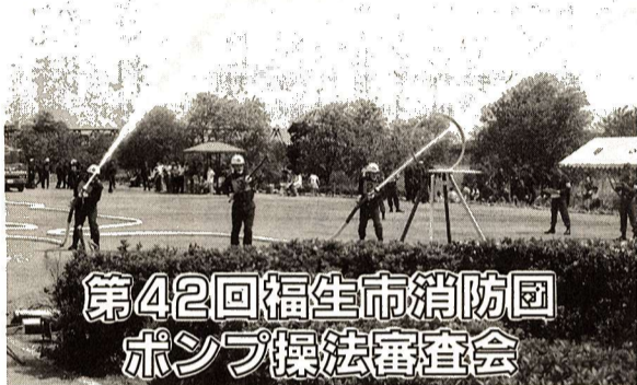
第42回福生市消防団 ポンプ操法審査会

この審査会は、災害の防御活動がいかに迅速かつ確実に行われるかを審査するもので、各分団から2チームずつ出場し、計10チームが日ごろの訓練の成果を競います。どうぞ皆さんご声援ください。