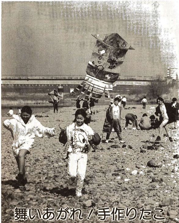
舞いあがれ！手作りのたこ

発行 福生市 〒197 東京都福生市本町5 編集 市長公室秘書広報課 市役所の代表電話番号 ☎ 0425-51-1511