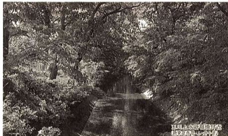
▲③玉川上水新堀橋付近