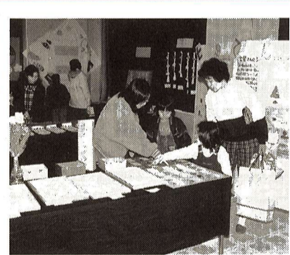
▶ 昨年の「けっさく展」から

市内の子どもの様々な分野の作品を集めた「けっさく展」です。 子どもたちの力作、熟演をご覧になり、子どもたちの世界に触れてみませんか。 日時・内容 3月12日(土) ○作品展Ⅱ工作・手芸・絵など(午前9時~午後5時) ○おはなしのひろばⅡエプロンシアター「おふるやさんいこう」(午前10時30分~11時) ○第86回子ども映画館Ⅱそれいけ!アンパンマン「つみき城のひみつ」(午前11時~正午) ○あそびのひろばⅡ落書きコーナー、輪投げ、ペーゴマなど(午前10時~正午、午後1時30分~3時30分)※雨天中止 ○工作のひろばⅡ剣をつくらう 3月13日(日) ○作品展Ⅱ工作・手芸・絵など(午前9時~午後4時) ○舞台発表Ⅱ田園太鼓、元気な合奏など(午前10時30分~) ○あそびのひろばⅡ落書きコーナー、輪投げ、ペーゴマなど ○ギネスに挑戦Ⅱあきかんつみ、ピー玉つかみ、なわとびなど(午後1時~2時) ○きつさ店(午後1時15分~) ○きつさ店(午後1時15分~) ○ギネスに挑戦Ⅱあきかんつみ、ピー玉つかみ、なわとびなど(午後1時30分~3時) ○劇団ファンタスティック公演「天の炎」(ふくろうと子ども) (午後3時~4時) ○ウルトラクイズ大会(午後4時~)