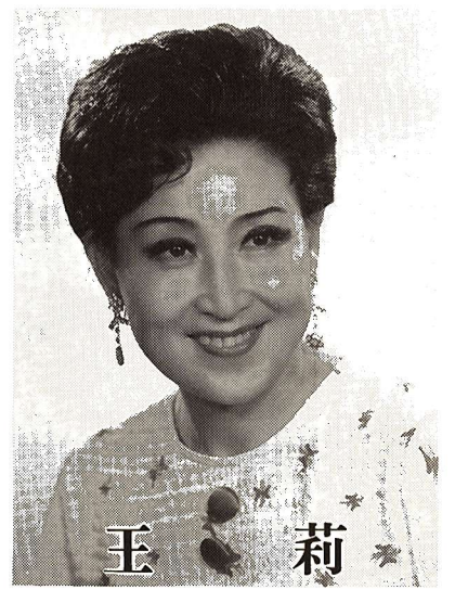
中国琴コンサート

鮮やかな弦の音色に情 感豊かな唄声の響き 中国琴。その音色はハ ープにも似て、独特の魅力 を放ちます。