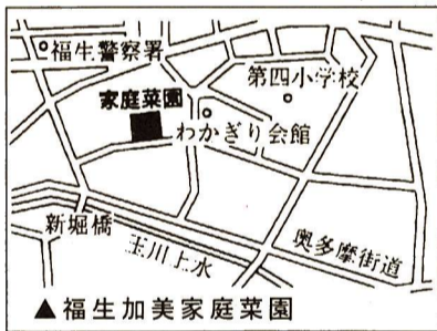
◇ 家庭菜園案内図 ◇

貸出区画数 合計321区画 ▽熊川東 183区画 ▽鍋2 57区画 ▽福生加美 81区画 貸出期間 平成6年4月1日～平成8年3月15日(約2年間) 費用 2,000円(期間中の水道代、ゴミ処理費用など)