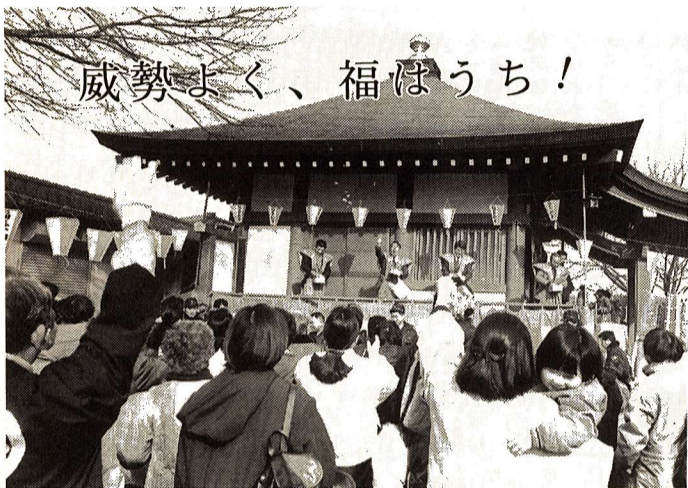
威勢よく、福はうち!

発行 福生市 〒197 東京都福生市本町5 編集 市長公室秘書広報課 市役所の代表電話番号 ☎ 0425-51-1511