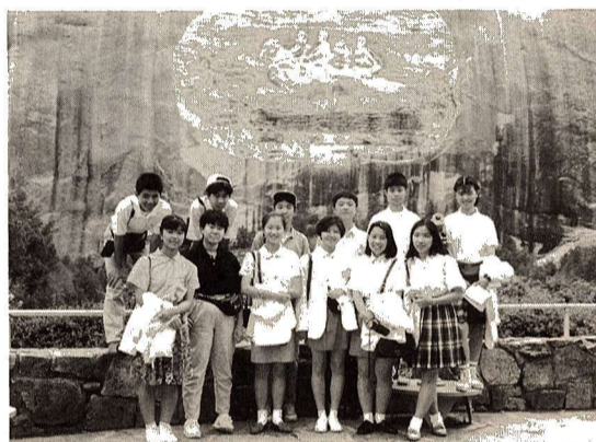
▲昨年のジュニア大使友情使節団

市では、平成6年度も青少年海外派遣事業「ジュニア大使友情使節団」を行います。この事業は、外国との友好親善と相互理解、国際的な視野をもった、心身ともに健全な青少年を育成することを目的として行っているものです。海外に派遣されますと、滞在期間中は、現地の方との交流、施設見学、表敬訪問などのほか、外国人家庭の一員として生活するホームステイも行います。参加を希望される方は、次の要領により応募してください。