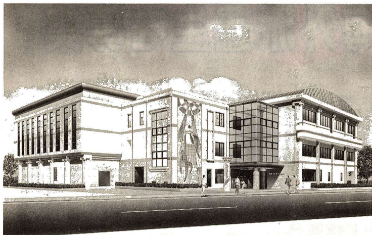
▲福生地域体育館（仮称）完成予想図