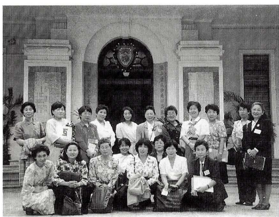
▲香港保良局の前で

この国を訪れてより感じたのですが、近年急激に人口が都市部へ集中したことにより核家族化が進み、女性が社会に進出する傾向が著しくなってきました。それにともない、社会に対する意識の変化、特に若い世代を中心に古い風習・慣習にとらわれない柔軟な意識が芽生えてきています。それゆ