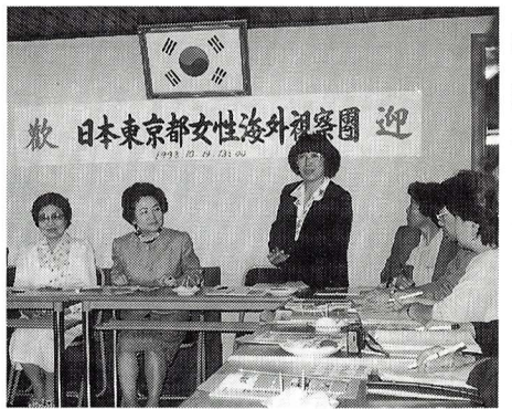
▲韓国婦人会とのディスカッション

え、世代別の意識のギャップも大きく、また、混沌としています。それは、女性に対する意識や見方にも反映しており、性別役割分業の考え方やなどに世代別、地域別によりかなりの隔たりがあるのを感じました。また、各福祉面の対応が、社会的要求に間に合わず、家庭内で対応しているのが現状のようです。