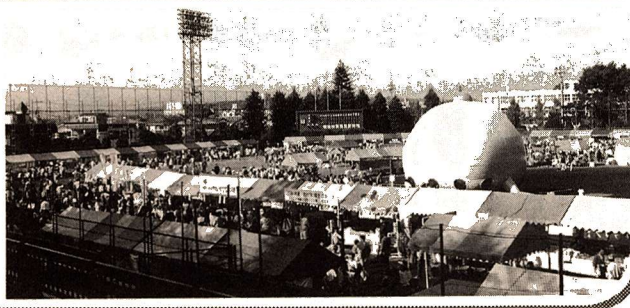
市債の状況 (特別会計を含む) (平成5年9月30日現在)

健康まつり、産業祭、市民文化祭を合同で行う「福生ふれあいフェスティバル」が10月31日(日)に市営福生野球場で開かれ、秋晴れのもと15,000人の人出でにぎわいました。