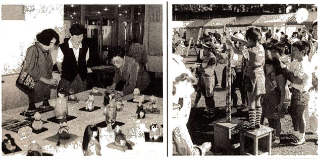
福生ふれあいフェスティバル

健康まつり、産業祭、市民文化祭を合同で行う「福生ふれあいフェスティバル」が10月31日(日)に市営福生野球場で開かれ、秋晴れのもと15,000人の人出でにぎわいました。