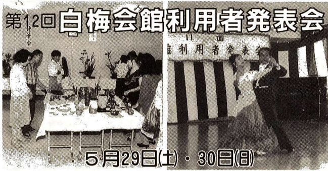
第12回白梅会館利用者発表会 5月29日(土)・30日(日)

場所 公民館視聴覚室 対象 聴覚障害者の方 定員 先着30人 問合せ 公民館本館へ。