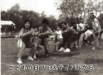
こどもの日フェスティバルから