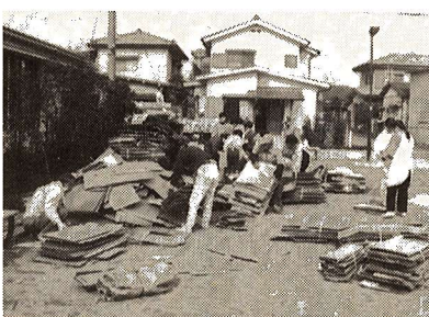
▲町会による資源集団回収

減量に向けては、資源回収実施団体への報償金の引き上げなどによる資源回収の強化と、新たに家庭用ごみ焼却器購入の補助の制度化に取り組んでいきます。