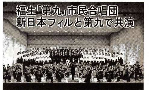
福生「第九」市民合唱団 新日本フィルと第九で共演

3月19日(金)に、福生「第九」市民合唱団と新日本フィルハーモニー交響楽団による「春の第九演奏会」が、市民会館大ホールで開催されました。