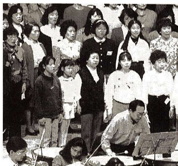
▶本番直前のリハーサル風景

そして、オーケストラのすばらしい管弦楽の演奏が続き、ファイナルは、合唱団、オーケストラ、プロのソリストによる「第九」の演奏でしめくられ、会場をうめた聴衆は、惜しみない拍手と歓声を送っていました。