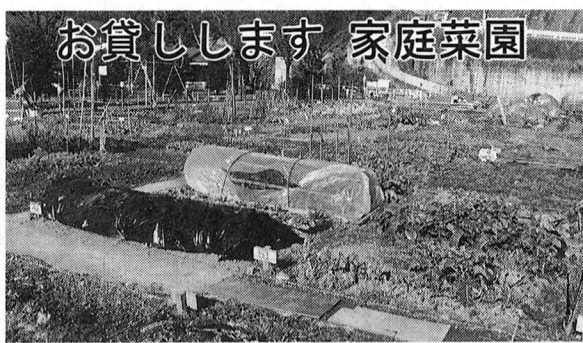
お貸しします 家庭菜園

4月1日から、北田園の家庭菜園をお貸しします。貸出区画数は85区画です。余暇を利用して野菜作りの楽しさを味わってみてはいかがでしょうか。