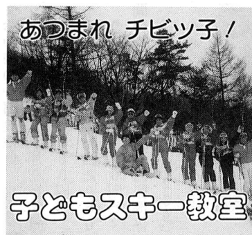
子どもスキー教室