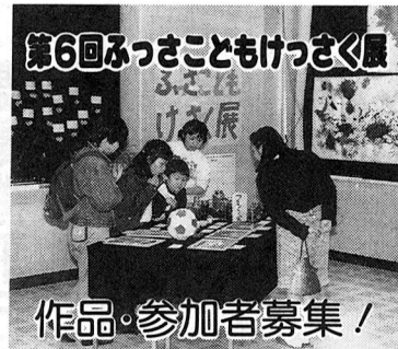
作品・参加者募集!

※グループ参加の場合は、子どもを中心とした社会教育関係団体に限ります。 内容 ダンス、歌、演奏、劇などの展示。工作、習字、手芸などに限ります。 申込み受付期間 2月1日(月)～3月11日(木)