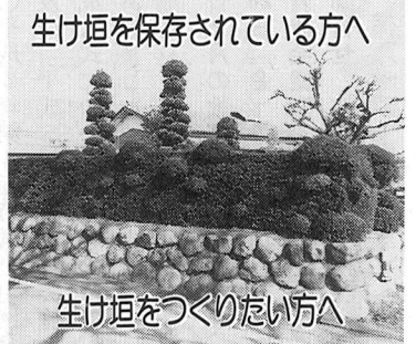
生け垣を保存されている方へ 生け垣をつくりたい方へ

4月分から口座による毎月納付を希望される方は、3月31日(水)までに金融機関へお申し込みください。 なお、平成5年度の国民年金保険料は下の表のとおりです。 問合せ 保険年金課年金係(☎51-1511内線273・274)へ。 市では、生け垣を保存されている方に奨励金を、生け垣を新設される方に補助金を出しております。 なお、生け垣新設の場合は、撤去する塀等にも補助金が出ますので、計画時点で申請をしてください。