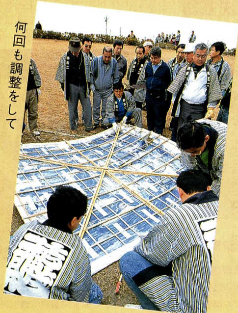
何回も調整をして