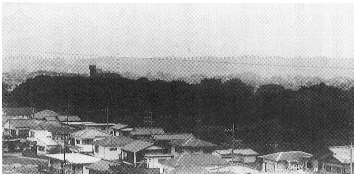
熊川緑地(仮称)みずくらいど公園と武蔵野陸橋の間

平成3年度一般会計上半期の財政状況は当初予算額167億1,426万8千円で、その後3回の補正と平成2年度から平成3年度に繰り越して使用することが認められた予算を加え、総額182億4,626万9千円となりました。