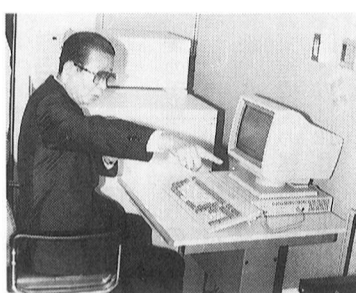
電算化により充実した予防接種システム(健康センター)

歳入の支出済額は、67億5,683万3千円で支出率は37.0パーセントとなり、昨年同期と比較し3.3ポイントの増となりました。この主な理由は、支出総額のうち大きな構成比を占める建設費の増加です。