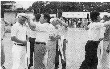
▲昨年の防災訓練から

福生市では、防災関係機関等の協力により防災訓練を実施します。消火器や三角バケツによる初期消火訓練、三角布による応急救護訓練などを行い、自主的な防災行動を身につけることを目的としています。ご家族おそろいで参加しましょう。 午前9時(警戒宣言発令)と午前9時30分(発災の合図)にサイレンを鳴らします。