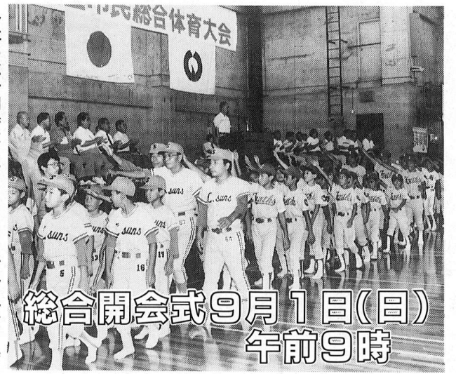
総合開会式9月1日(日) 午前9時