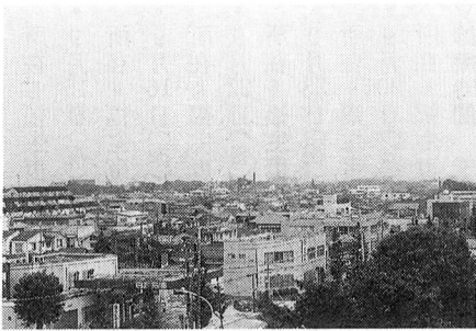
▲市役所屋上から牛浜方面を望む

本部は八王子で、福生のほかに近くでは五日市、松原、御岳山などにもありました。立哨台に双眼鏡を持って登り、機影を探すのです。曇り