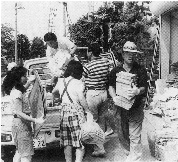
▲本町七町会による資源回収(7月7日)

不用になった新聞や雑誌などの古紙は、『再生紙』として生まれ変わり、同じように新聞や雑誌、ダンボールなどに利用されます。例えば、家庭で出る新聞1年分(約百キログラム)をゴミ処理した場合、約2、100円の費用がかかります。しかし、古紙として再利用すれば、一本半の立木(直径20センチ、高さ8メートル)を切らずにすみますので、緑を守ることに貢献します。