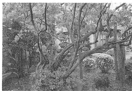
▲ 石川家のヤシオツツジ

展示の内容は『福生の名木』に掲載した市内の名木89本の写真パネルのほか、各樹木の分布図、さらに同報告書で使用したカラーイラストの原画15点です。