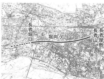
▲ 長者堀の推定流路

長者が自邸に引き入れたという堀は、取水口は不明ですが、拜島段丘崖を南東へ堀り進み第2小学校のすみをかすめ、拜島駅南口の映画館の裏手あたりの長者屋敷へと続いていたといえます。この堀跡は最近まで目で確認することの出来る窪みがあったともいわれ、熊川616番地付近では幅4・5メートル、深さ2・5メートルの溝状の遺構が発見されています。