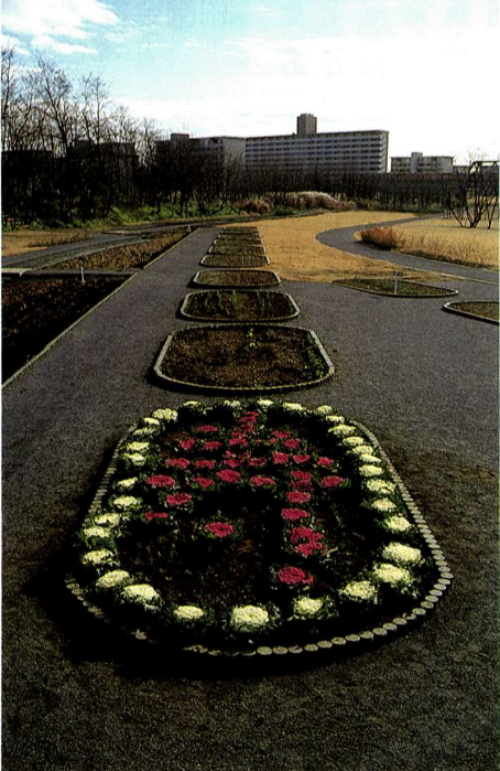
▶「寿市民ひろば」の会員による花いっぱい運動