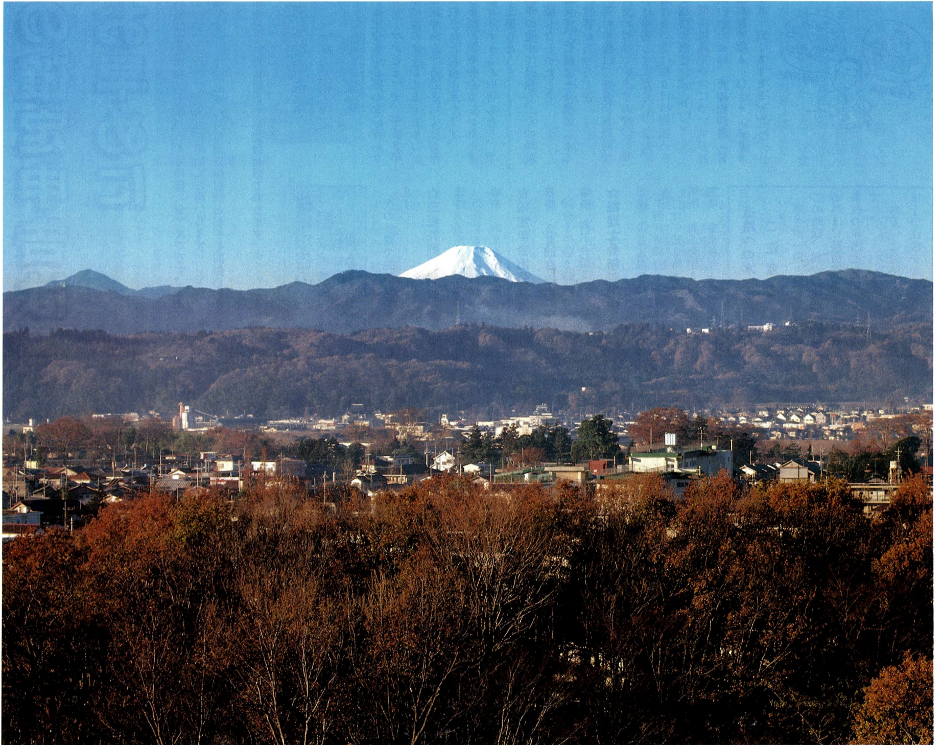
▲みずくらいど公園の雑木林と富士山

市の人口と世帯 (平成3年1月1日現在) 人口 59,085人 男 29,970人 女 29,115人 世帯数 22,712