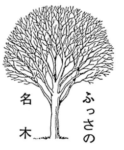
ふっさの名木 福生四小のギンモクセイ 所在地 福生1290 樹高・幹回り(目通り) 7.5m/155cm

花の魅力はと問われたら、見目の美しさをあげるのが一般的ですが、それよりむしろ、花の香りに印象の強いものもあります。具体的には初夏のクちなシと、今回紹介する秋のモクセイがこのような芳香花をつける日本の樹木の筆頭でしょう。 モクセイは中国原産の樹木で、樹肌が犀の肌似ていることから木犀と書きます。モクセイという一般にはキンモクセイを指すようですが、キンモクセイはギンモクセイの変種であり、狭義には後者を指すのが正しいようです。ここで紹介する樹木も後者ですが、区別するためギンモクセイと呼びます。