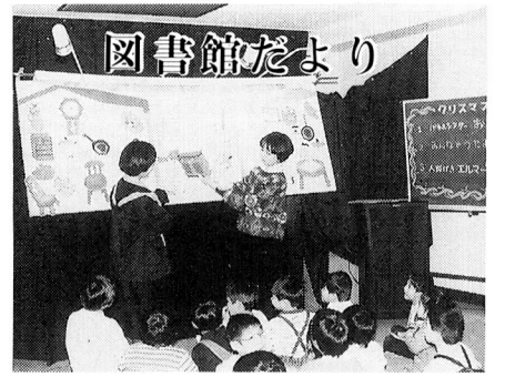
分館が日曜日の午前中も開館します

2月から、わかぎり分館、わかたけ分館の利用時間が次のように変更となります。 日曜日 午前10時～正午 午後1時～5時 正午から午後1時までは昼休