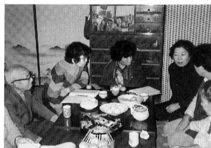
▲メエダマの聞き取り

「オツイタチだから赤飯ふかしたの。調べはあとにして、サツ食べて。煮ものもあるよ。」