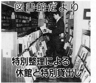
特別整理による休館と特別貸出し