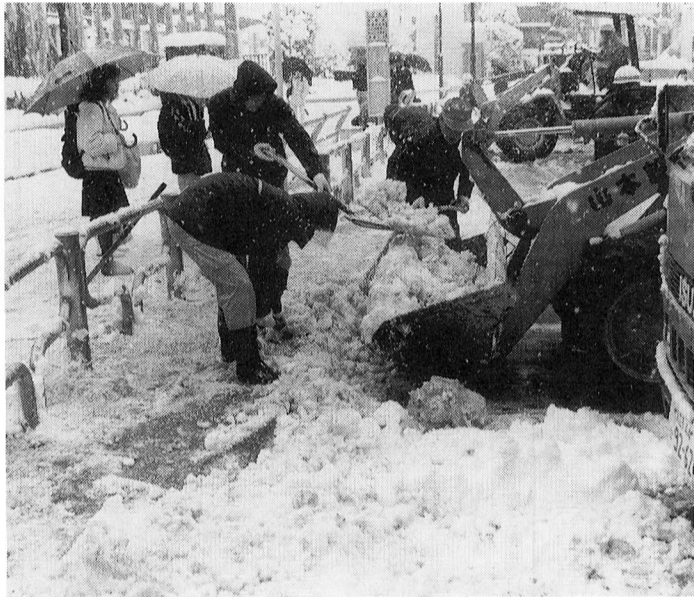
▲ ドカ雪と奮闘、除雪作業

市の人口と世帯 (平成2年2月1日現在) 人口 58,098人 男 29,316人 女 28,782人 世帯数 21,990