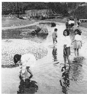
▲ 親しまれる中福生公園

良事業費1億3,579千円、第四小学校防音機能復旧事業費8,182万7千円、第六小学校温度保持事業費3,480万5千円、第七小学校視聴覚反応分析器設置事業費2,668万円、中学校費3億1,458万円(第一中学校語学演習装置設置事業費3,533万円、第三中学校外壁改良事業費4,106万9千円)となっております。