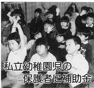
私立幼稚園児の保護者に補助金

年度末の3月下旬は、登録の窓口が大変混雑します。お持ちの自動車で住所変更・名義変更・廃車手続きの済んでいないものはありませんか。自動車の登録手続きは、遅くとも3月中旬までに済ませてください。 なお、第2、第4土曜日はお休みです。 問合せ 八王子自動車検査登録事務所(☎0426-91-6361)へ。