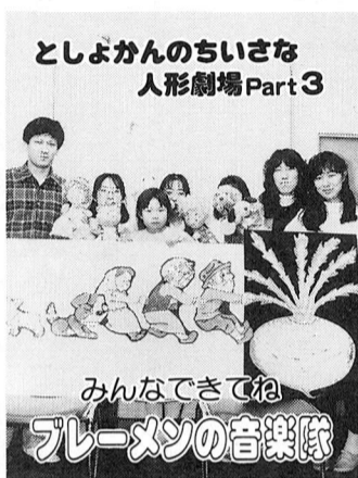
としよかんのちいさな人形劇場Part3