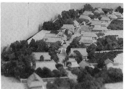
▲牛浜集落復元模型(250分の1)

主な展示品は、福生市指定文化財の「牛浜出水図」、天明八年(一七八八)に幕府巡見使へ提出した村絵図、天保七年(一八三六)に元禄の国絵図の訂正のために作成された村絵図、そして江戸時代、玉川上水に架かる橋を描いた「上水控」等々です。その他、参考資料として「牛浜出水図」に描かれた牛浜集落を二五〇分の一に復元した模型もあります。図中の民家を