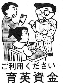
ご利用ください 育英資金

次の要件に該当される方は、忘れずに申請をしてください。 ■該当する方 市内に居住(住民基本台帳または外国人登録原簿に記載されている方)し、私立幼稚園に通園している園児(3歳児・5歳児)の保護者で、保育料を納入している方。 ■補助額(月額) 園児1人当たり6、100円 今回の支給は後期分(10月・3月分)です。 ■申請期限 3月2日(金) ■申請先 通園している各幼稚園へ提出してください。 なお、申請用紙は2月中旬に各幼稚園から配布されます。この時期に配布されなかった場合は、庶務課庶務係(☎51-1511内線252)へご連絡ください。