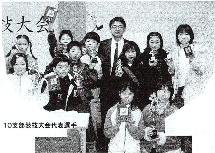
10支部競技大会代表選手

3月にそろばん派遣講師で行った小平第十五小学校の3年生から、うれしい感想文をいただきました。先生にも本人にも許可をいただいたので、ここに載せます。担任の先生が3年生に「そろばんの達人」の先生が来てくれるよ、と宣伝してあったそうで、恥ずかしながら、そのまま載せさせていただきます。