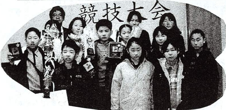
写真は3月7日の珠算競技大会当校代表選手団です。