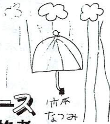
暗 ドン なつみ