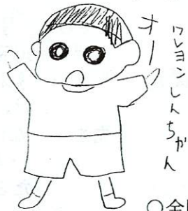
ワリンパ しんちが ん