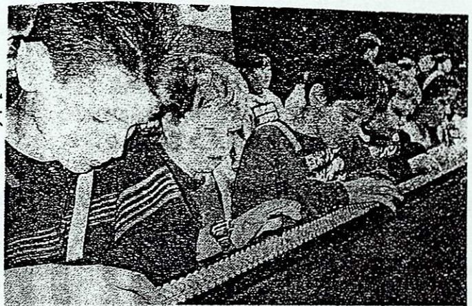
はじき初めに挑むアメリカンスクールなどの小学生たち