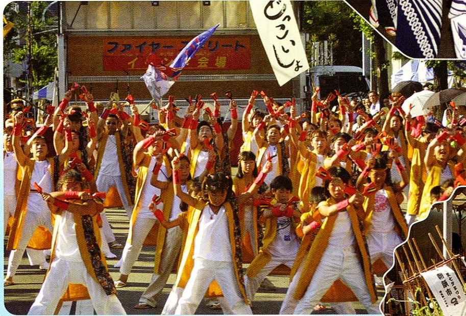
ふっさ 福生ソーランまつり Fussa Soran at Tanabata Festival