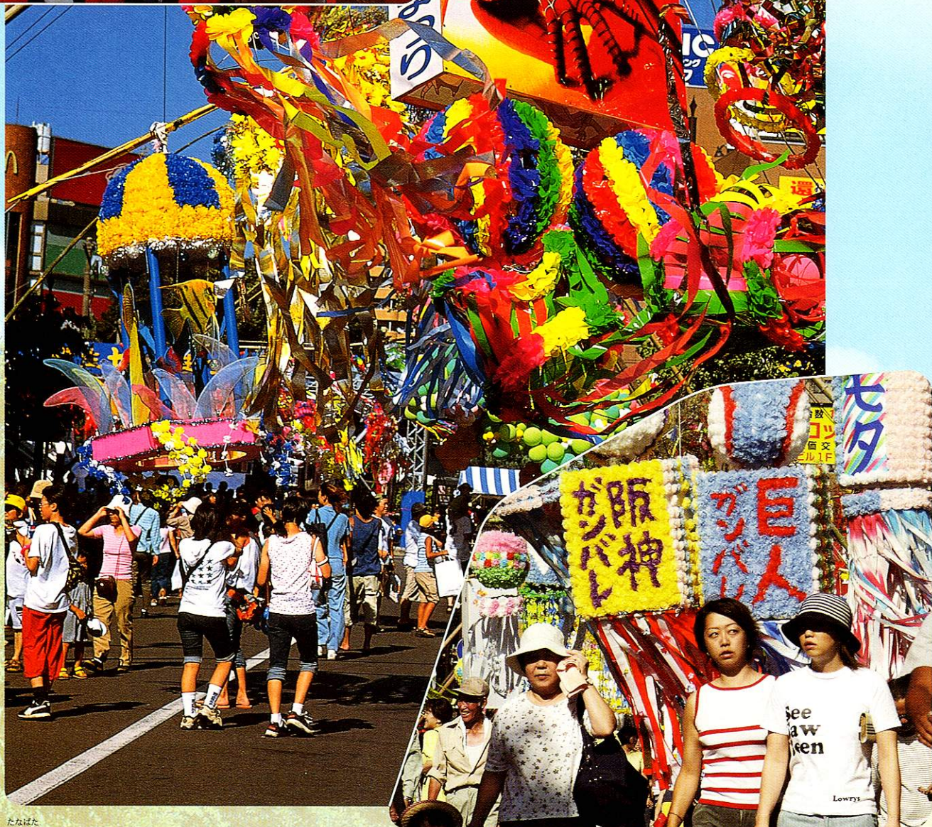
七夕まつり Tanabata Festival

8月初旬に福生市の街を上げてのビック・イベント「福生七夕まつり」が華やかに開催されます。福生駅前を中心に色とりどりの竹飾りが商店街を埋め尽くします。