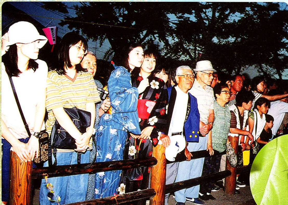
まつり ほたる祭 Hotaru Festival (Firefly Festival)

歴史あるこのお祭りは7月の終わりに八雲神社の祭礼として行われ、数多くの山車や御輿が市内を練り歩きます。