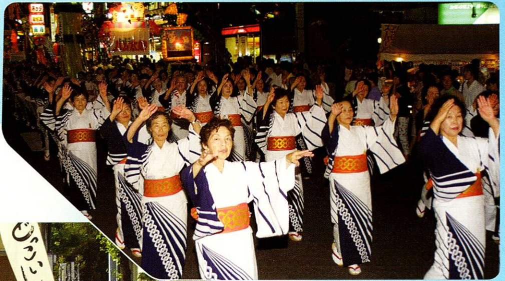
みんよう 民謡パレード Folk song and dance parade