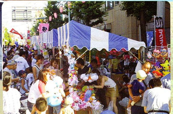
しみんもぎてん 市民模擬店ギャラクシーストリート Citizen presenting snack bars in Galaxy Street