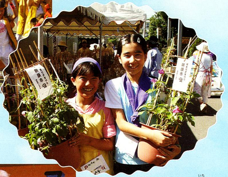
小学校のあさがあ市 いち An elementary school-sponsored Morning Glory Market