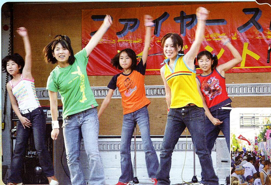
かつさ チャレンジ福生キッズ Challenge Fussa Kids (Kids Dancing at Tanabata Festival)