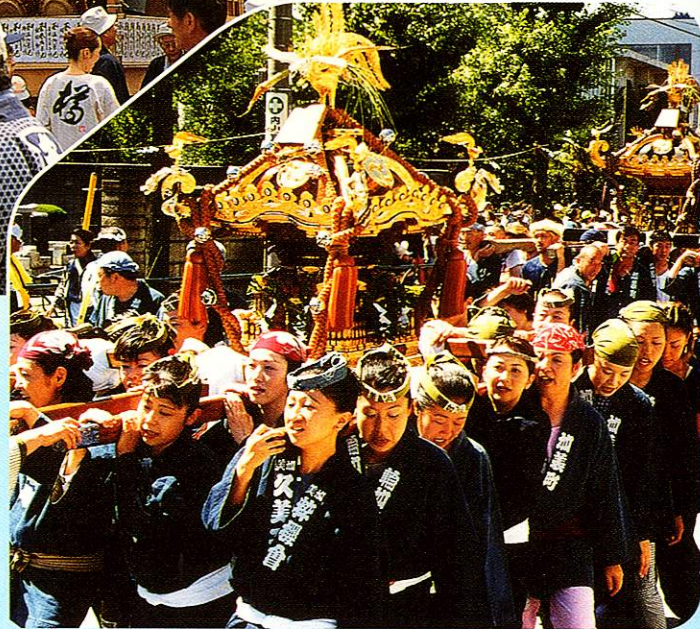
やぐも 八雲まつり Yagumo Festival

歴史あるこのお祭りは7月の終わりに八雲神社の祭礼として行われ、数多くの山車や御輿が市内を練り歩きます。