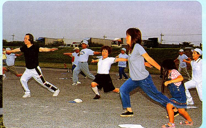
たいそう ラジオ体操 Radio gymnastic exercises