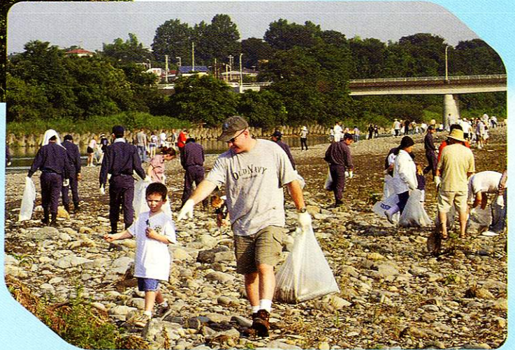
たまがわかせんせいそう 多摩川河川清掃 Tama River cleaning program