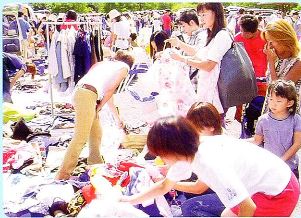
ガレージセール となりの不用品は、我家の宝物 The discarded articles of neighbors will become our treasures