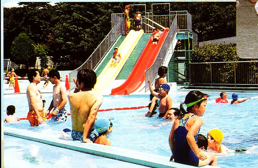
しえい 市営プール Swimming pool