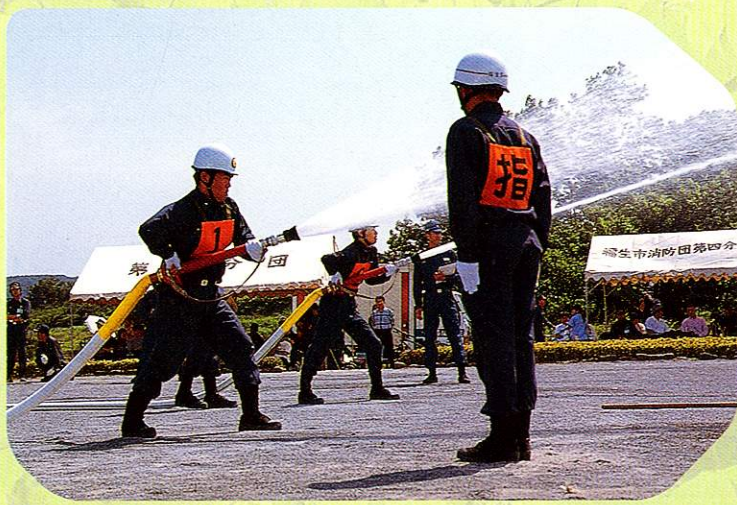
そうぼうしんさかい ポンプ操法審査会 Fire pump operating examination

市では、昭和28年から消防団の訓練の一つとしてポンプ操法審査会を毎年実施しています。災害の防護活動が迅速かつ確実に行われるのを審査するものです。