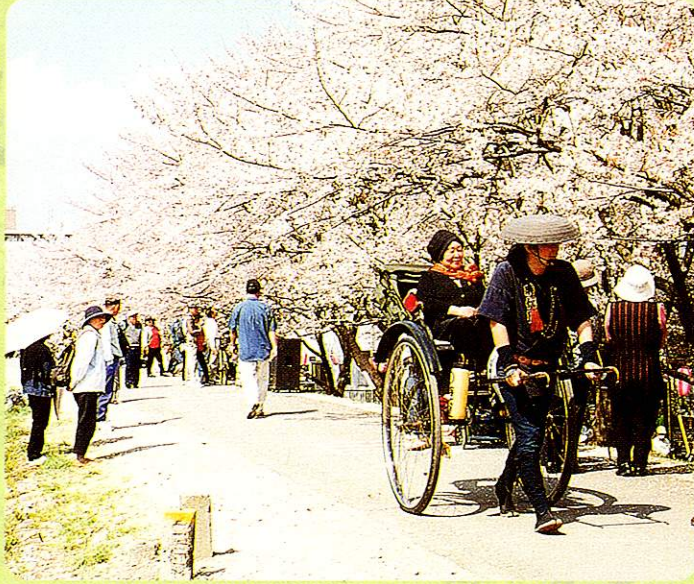
さくら 桜まつり Cherry Blossom Festival

The cherry blossom brings spring to Fussa. The vivid green leaves increase their brightness and each citizen enjoys the coming spring.