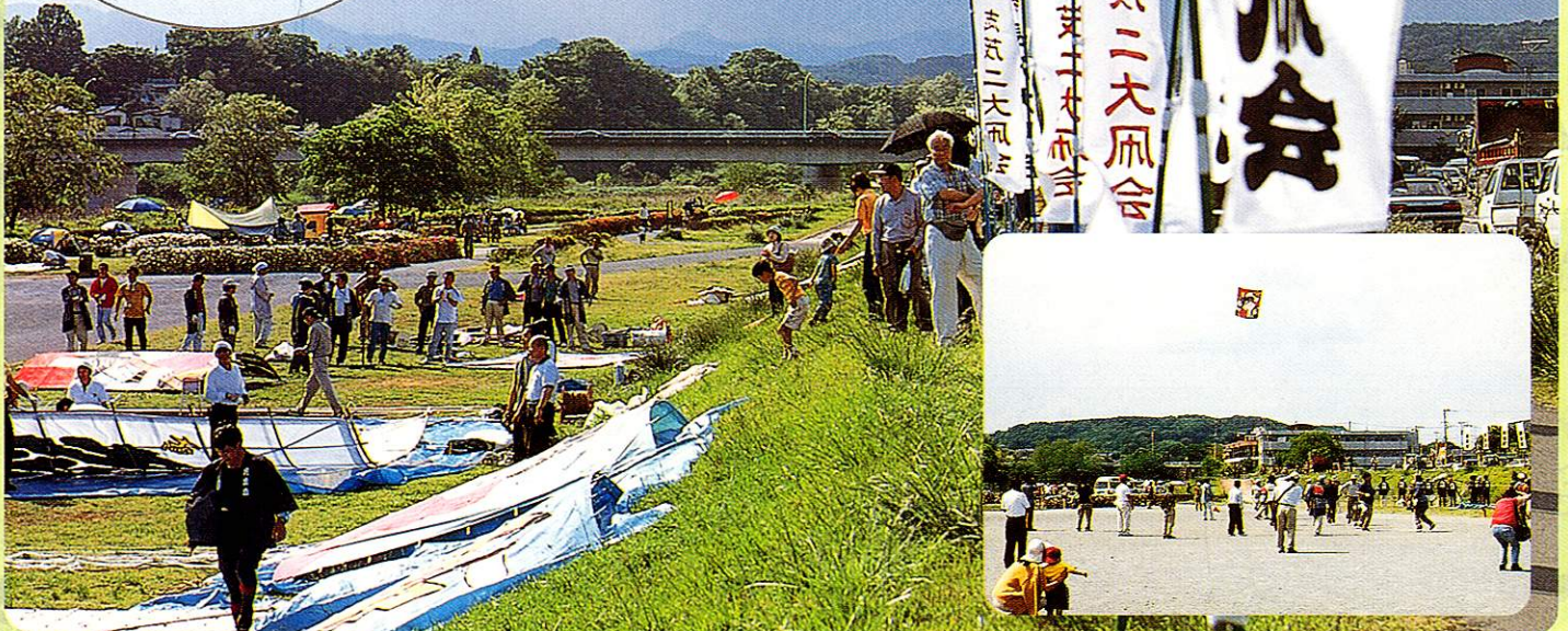
おおだこあ 大凧揚げ Big Kite-Flying Festival

福生市内に有志による4つの同好会があり、大凧連合会を結成しています。毎年5月5日多摩川中央公園で競う大凧揚げは夢とロマンを与えてくれます。