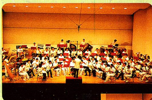
しみんおんがくさい 市民音楽祭 みどりのハーモニー Civic concert: Green Harmony