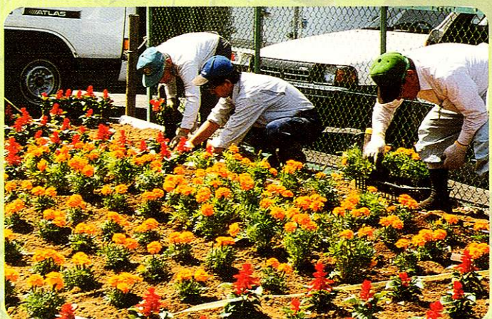
はな うんどう 花いっぱい運動 Flower planting campaign