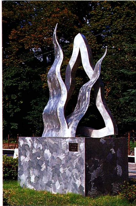
「三角形の周囲Ⅱ」小井土満 作 福祉センター敷地内