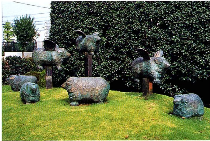
「五月の風」中林彰 作 中央体育館敷地内

市内のあちこちで、数々の彫刻が街の景観に溶け込み、道ゆく人をなごませています。福生市では昭和63年から都市景観事業に取り組み、芸術美あふれるまちづくりを進めてきました。現在は環境彫刻コンクールを行い、多摩在住作家の優秀作品を選んで設置しています。平成8年度までに市内に27点の作品が設置され、街全体が大きなミュージアムになっています。