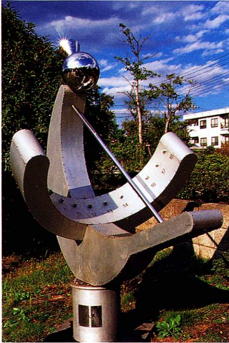
「陽光と共に」住谷正巳 作 明神下公園内

There are many places around Fussa where you will find sculptures that blend well with the surrounding scenery and are a pleasure to view. Since 1988 Fussa City has been working to improve its urban scenery, promoting the building of a city brimming with art. At present the city holds an environmental sculpture contest to select outstanding works by resident artists. By the end of fiscal year 1996, 27 works had been installed around the city, turning the whole of Fussa into one big museum.