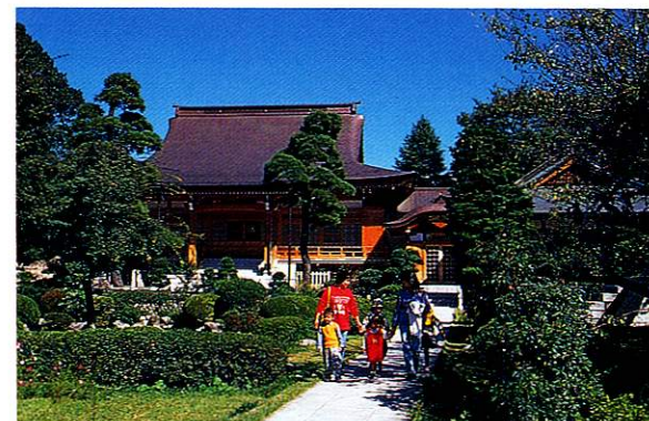
5 清岩院 約600年前に建立された古刹。境内には弁天堂とめずらしい車地蔵があります。本堂と日本庭園が風格を見せています。(現在の弁天堂は平成6年に、本堂は平成7年に新築されたものです)