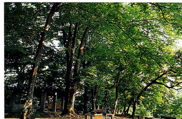
3 柳山公園 多摩川沿いに広がるケヤキの大木群が季節ごとに違った美しさを見せます。対岸からの眺めも見応え十分です。