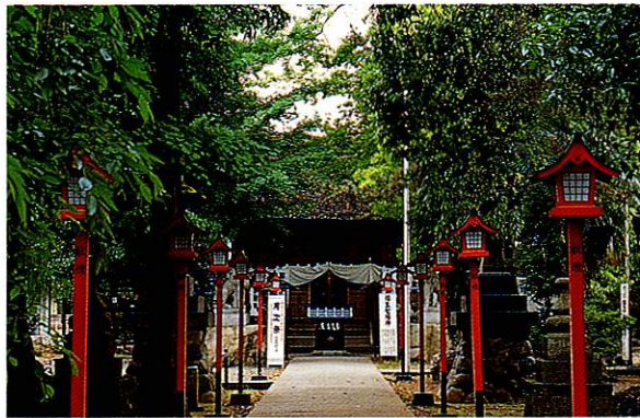
6 熊川神社 桃山時代の木造建築で素朴ながらも荘厳。社を覆う樹木が重厚な雰囲気をもたらしています。本殿は市内最古の木造建築で、東京都指定有形文化財。

There are 10 areas in Fussa City which are regarded as “Fussa’s most beautiful spots” and are popular among the local citizens. These spots include attractive scenery, distinctive urban landscapes, and cultural assets. The scenery at these places changes with the seasons, allowing visitors to constantly rediscover their attractiveness and tranquility.