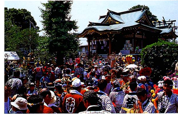
9 神明社 かつての福生村の各地域に祭られていた七神の合祀。大鳥居をくぐると境内の桜や楠の大木が印象的。「神明様」「やくし様」と呼ばれています。