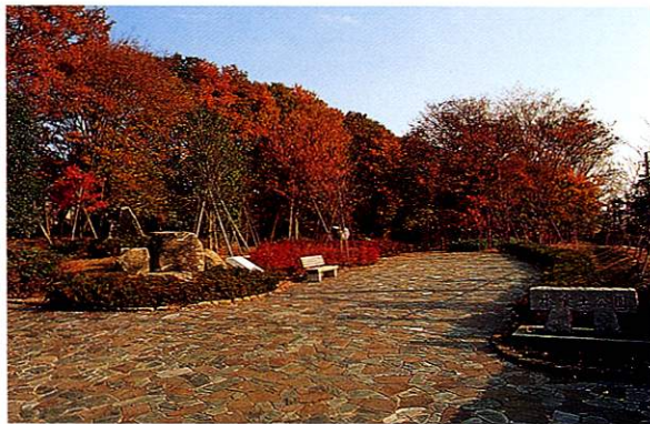
2 みずくらいど公園 玉川上水の堀を掘ったとき、砂利層が厚く水を吸い込んでしまったところから付いた「水喰土」と呼ばれる堀跡があります。自然な雑木林を残したくつろげる空間です。

福生は、たくさんの表情をもった街です。自然の色彩、都市のにぎわい、永い時を経た文化の香り。そんな街の個性的な素顔にふれるたび、ここに暮らす喜びと新たな魅力を感じることができます。