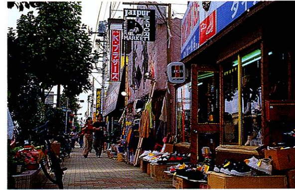
7 国道沿いの商店街 ここが日本？そう思わせるルート16沿いの商店街。横文字の看板、カラフルな歩道と街路樹がアメリカの風を感じさせます。