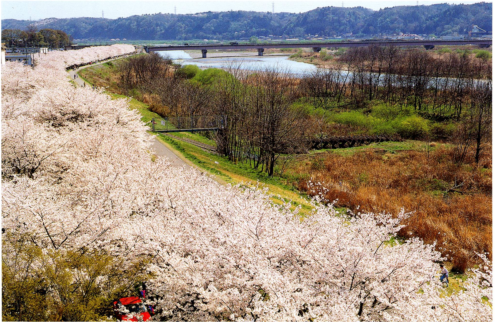
10 桜並木と多摩川 桜の季節になると多摩川の土手は一面薄桃色に彩られます。「桜まつり」も盛大に開催され、福生に春の訪れを告げます。