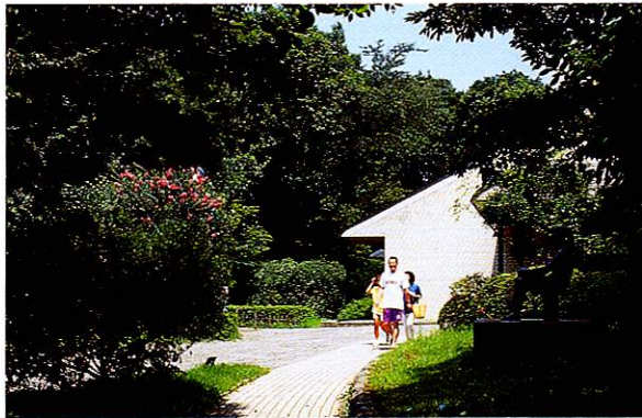
8 文化の森 武蔵野の面影を残す緑豊かな一角。散策路は中央図書館や茶室「福庵」へと続きます。