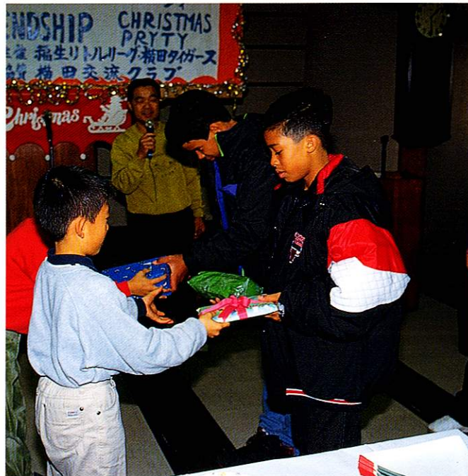
クリスマスのプレゼント交換をする、日米リトルリーグの子どもたち