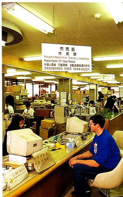
市役所には、外国人用案内プレートも備えられている

西多摩の交通網の拠点となる福生は、歴史的経緯も手伝って、あらゆる国の人、あらゆる年代の人が集まりやすい魅力ある街です。