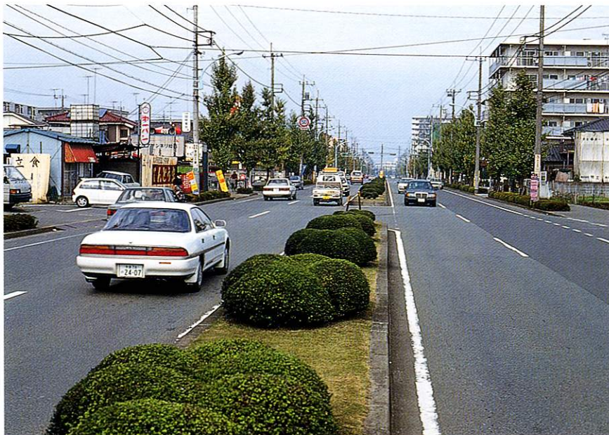
生活道路としても重要な産業道路