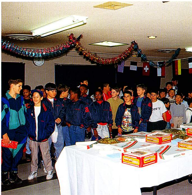
日米リトルリーグのクリスマスパーティー