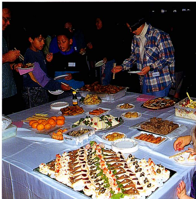
クリスマスパーティーでは、ずらりとごちそうが並ぶ