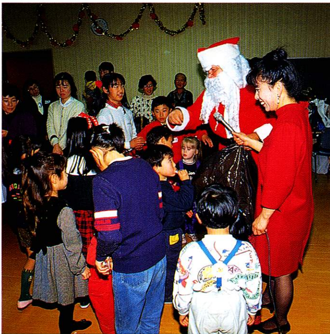
外国人を迎えてのクリスマスパーティー