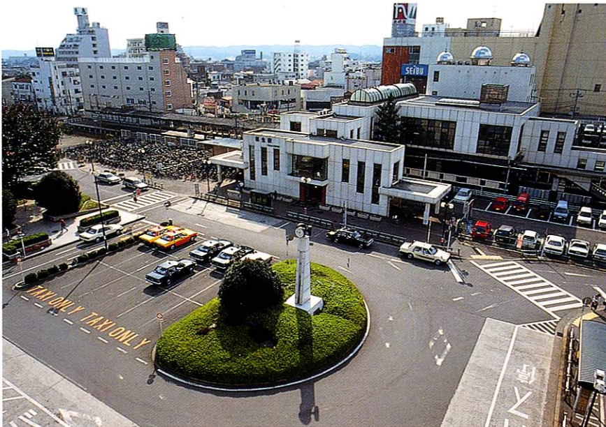
きれいに整備された福生駅