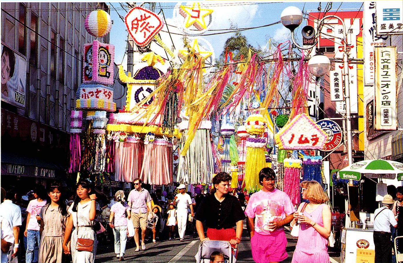
上●八雲まつり(7月) 中左●市営プールオープン(7月) 中右●市民総合体育大会(10月) 下●福生七夕まつり(8月)