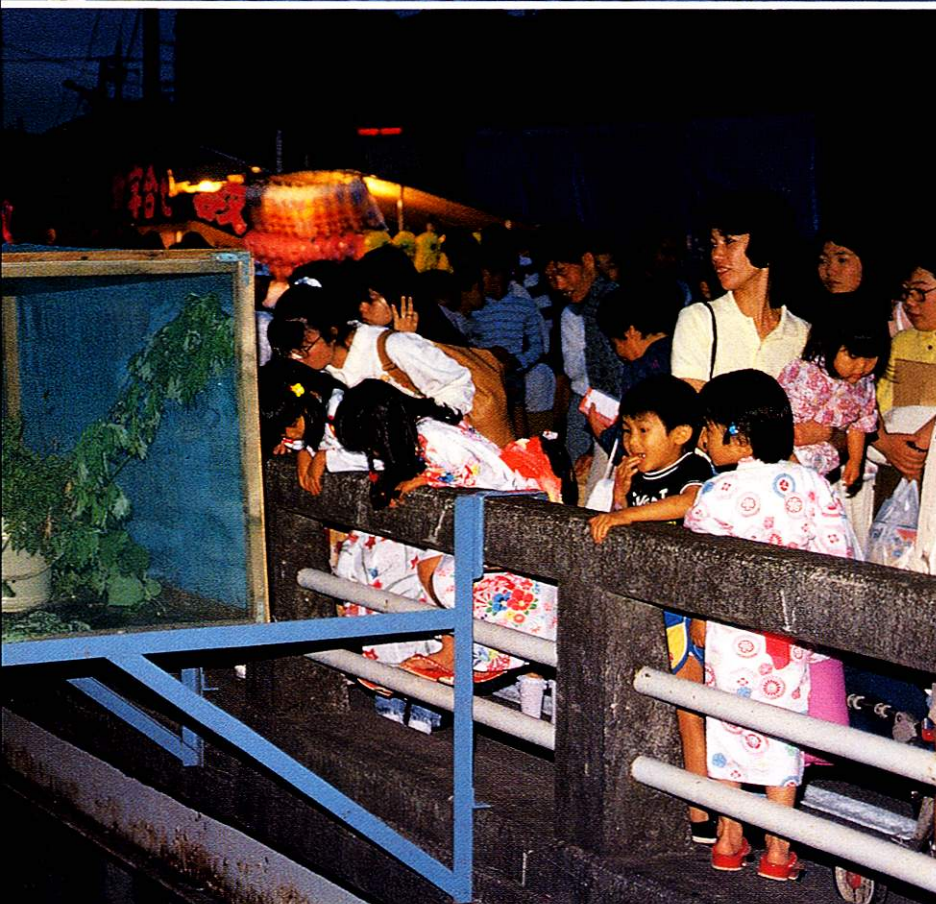
上●多摩川アユ解禁(6月) 下●ホタルまつり(6月)

新しい年を迎えたまちは、いつもと少し違った表情をしています。新年の幸を祈る気持ちはだれも同じです。熊川神社や神明社では、初もうでの人々が、一年の無事息災を祈ります。