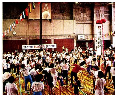
主婦と老人の運動会(6月)

夏の気配がひそかに薫り立つ6月。いよいよ多摩川のアユ解禁。多摩川には、朝早くから太公望たちが集まり、思い思いに釣糸を垂らします。中旬の土曜日には、玉川上水の青梅橋やほたる公園を中心に、ホタルまつりが開かれます。地元のほたる養殖研究会の人たちが育てた源氏ホタルが、