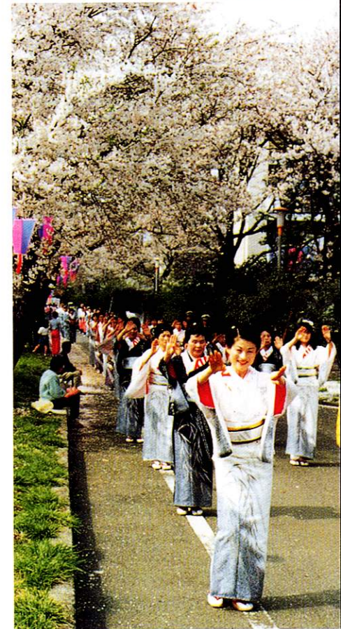
上●消防団出初式(1月) 中●成人式(1月) 下●ふっさ桜まつり(4月)