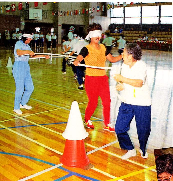
主婦と老人の運動会