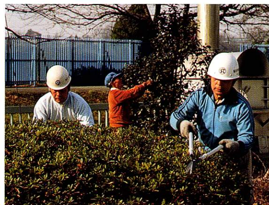
元気にシルバー事業