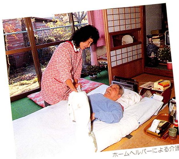
ホームヘルパーによる介護