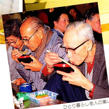
ひとり暮らし老人の集い