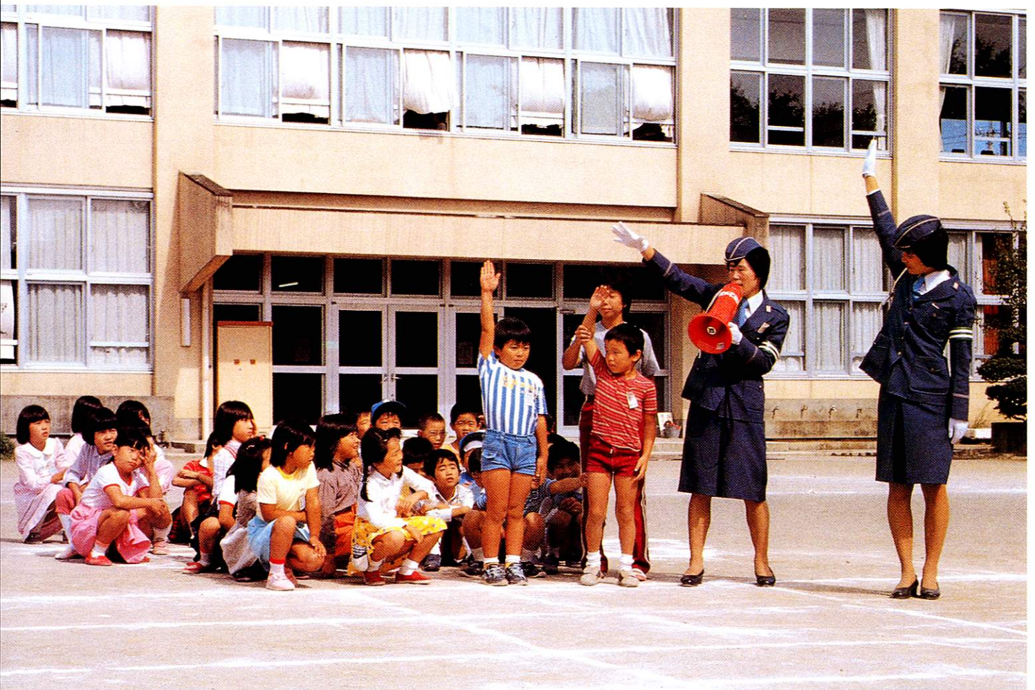
小学生たちの交通安全指導