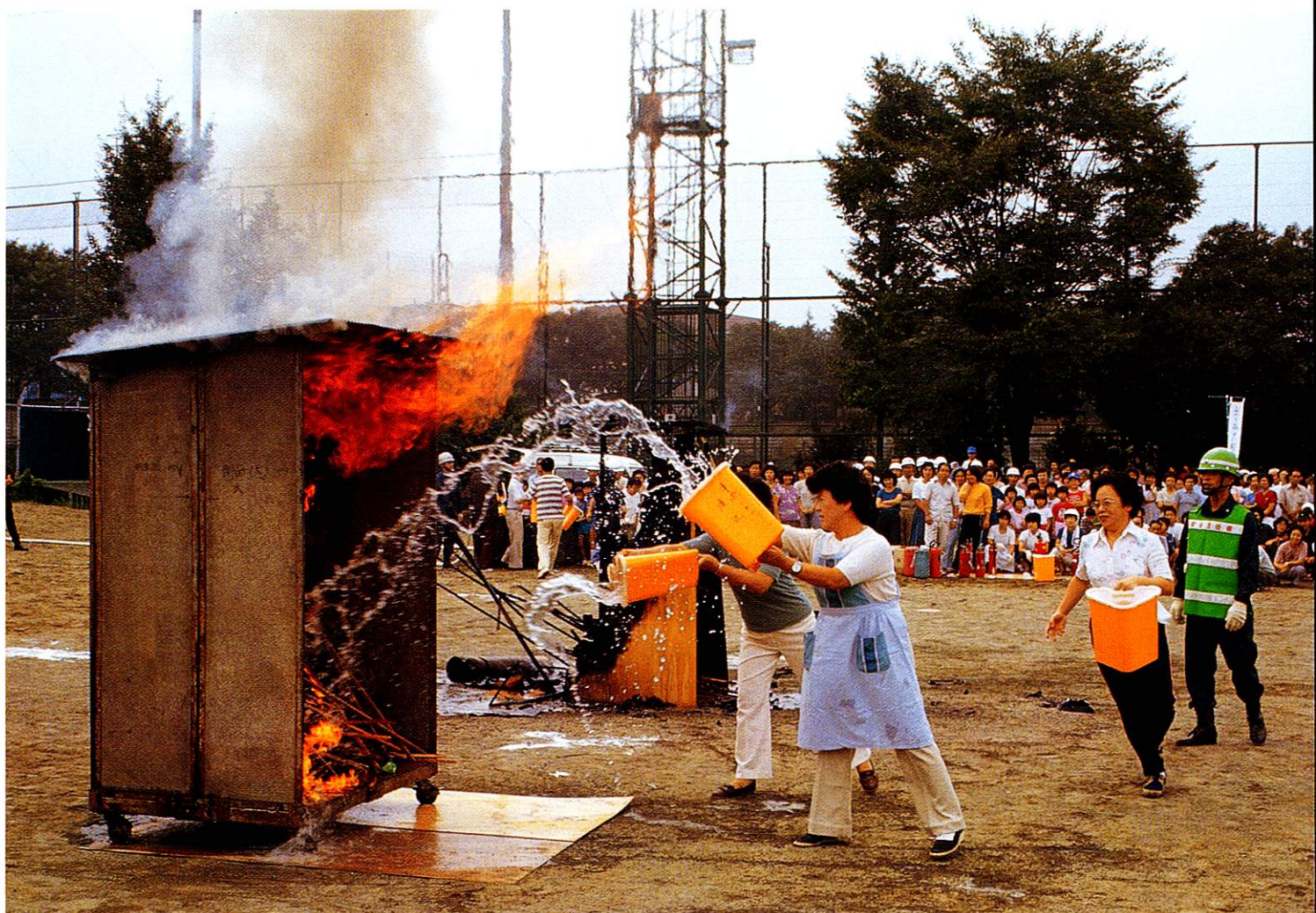
市民も参加して消火訓練

一方、救急業務は年々増え、1年間に出勤する救急車は1351件に達しています。市民が病気等で利用するケースがふえているため、救急活動の真の目的を理解してもらい、いざというとき役立つ“足”になることが求められます。