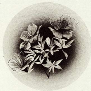
市の花：ツツジ(サツキ)