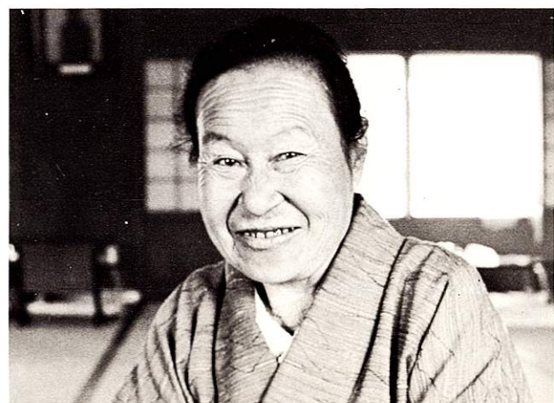
福祉会館を利用する人々