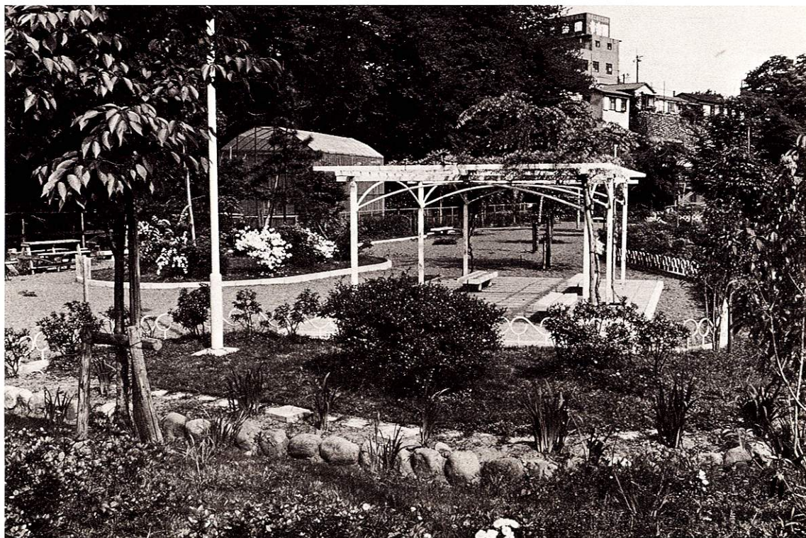
養殖水路もあるホタル公園 17