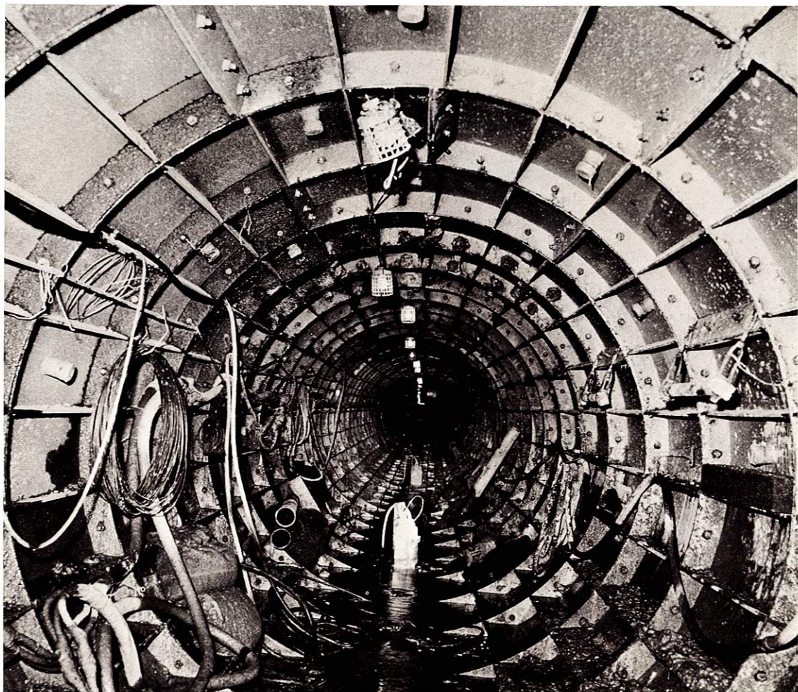
家庭の汚水を集めて処理場へ流す流域下水道