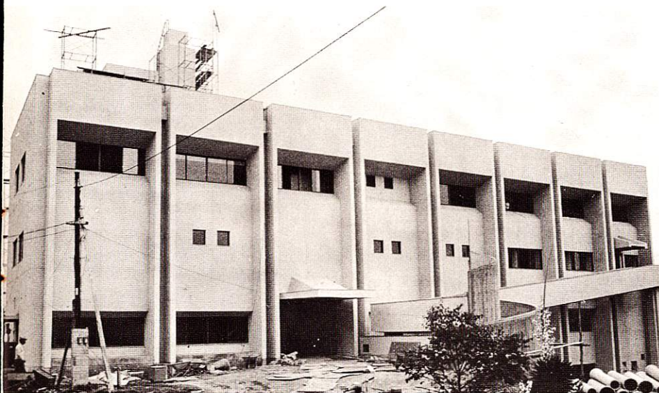
建設中の福祉会館