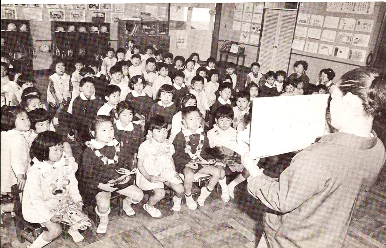
明るいホールで紙芝居を楽しむ すみれ保育園のよい子たち