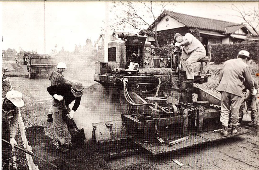
急ピッチで進む道路舗装工事