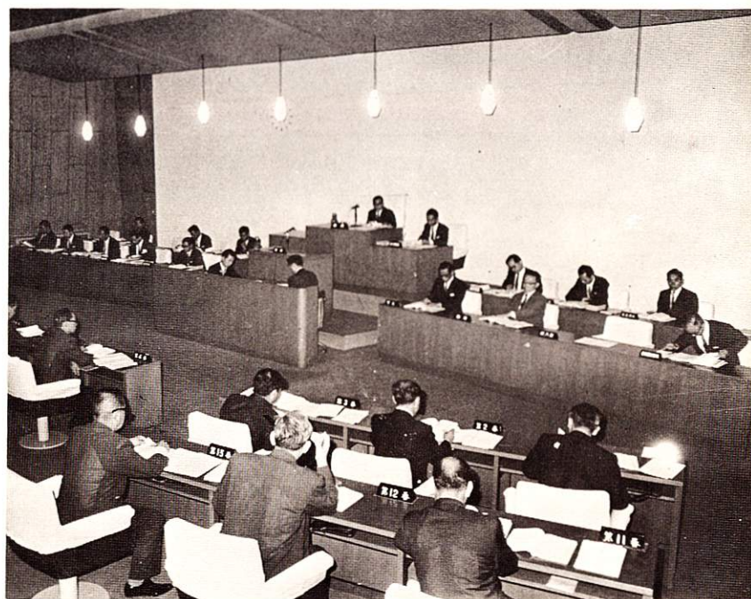
市議会審議状況 昭和44年